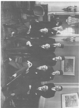
الجناس ياتوا وزعماء الأمة